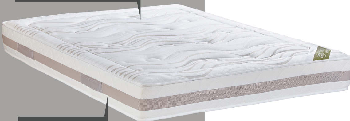
4 POIGNEES HORIZONTALES COUSUES