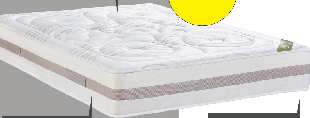
4 POIGNEES HORIZONTALES COUSUES

La mousse polyuréthane est une matière qui confère un soutien tonique et un bon maintien.