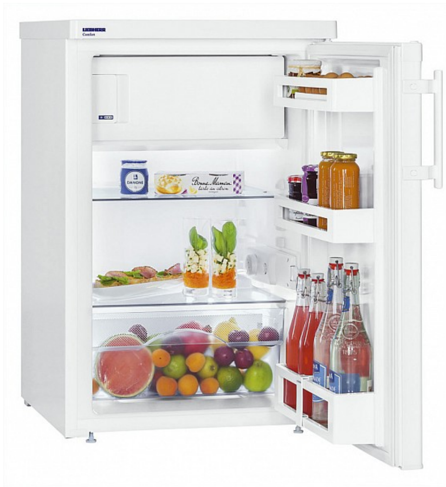
Table top 55 cm 4* Comfort