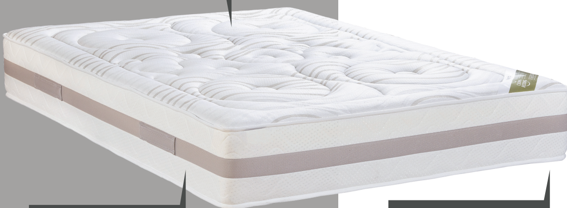
4 POIGNEES HORIZONTALES COUSUES