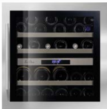
LB 340 INOX

Une niche originale pour une cave à vin, qui permet de mettre différents types de cépages à température de dégustation.