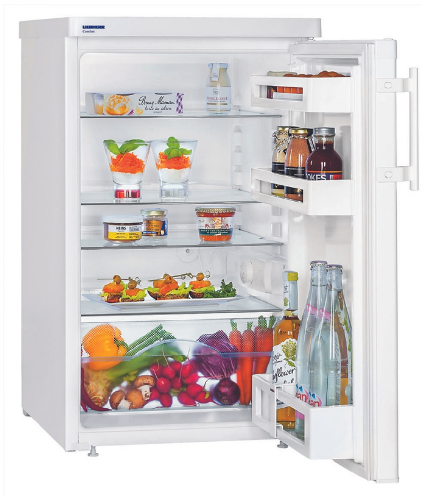
Table top 50 cm tout utile Comfort