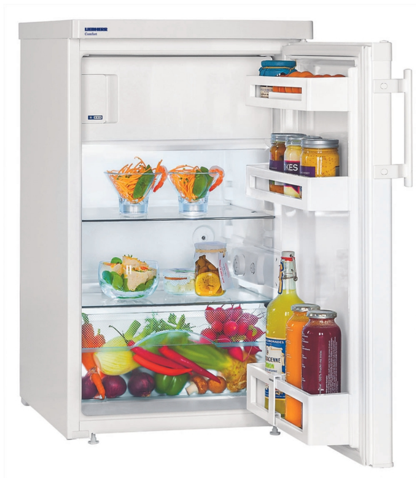
Table top 50 cm 4* Comfort