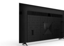
Passage de câbles intégré