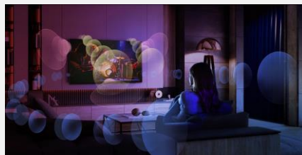
Virtualisation son 7.1.2

Développé par LG, le processeur α9 Gen 5 est le cerveau de votre téléviseur. La qualité d'image est optimisée : les couleurs sont plus riches et les scènes plus détaillées.