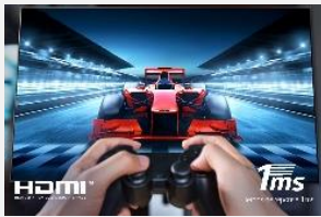
HDMI 2.1, VRR, ALLM

Prenez l'avantage sur vos adversaires. Compatible HDMI 2.1, VRR (G-sync et Freesync) et ALLM, pour offrir les contenus les plus rapides en haute résolution avec des graphismes fluides et synchronisés.