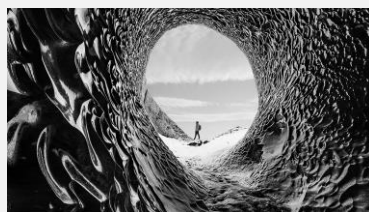
Noirs absolus et Contrastes riches

Magnifier la puissance des pixels auto-émissifs avec LG OLED evo. La technologie Brightness Booster offre jusqu'à 20% de luminosité supplémentaire* grâce à la gestion ultra précise du processeur α9 Gen 5 AI 4K. Désormais, les images sont incroyablement éclatantes grâce à une puissance lumineuse décuplée.