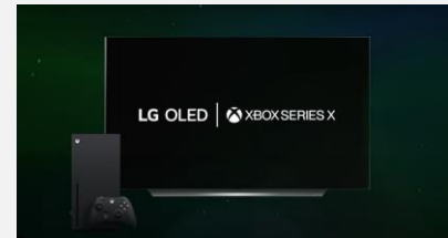
XBOX – Dolby Vision 4K/120is

Grâce à l'ajout des applications GeForce Now et de Stadia, tout un univers de jeux vous attend grâce au Cloud Gaming. Redécouvrez les jeux que vous aimez et trouvez de nouveaux favoris directement à partir de votre téléviseur.