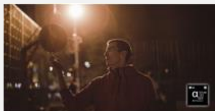
Processeur α9 Gen 5 AI 4K

Intertek, l'agence de test internationale, a certifié que les écrans OLED LG offrent une cohérence des couleurs de 100 %. Cela signifie que les couleurs qui s'affichent à l'écran correspondent fidèlement aux couleurs de l'image d'origine. Ainsi, tous les contenus que vous regardez correspondent à la vision qu'avait originellement le réalisateur.