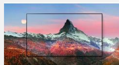
Cohérence des Couleurs

L'OLED est la technologie ultime pour les téléviseurs en matière de qualité d'image. En effet, la technologie OLED dispose de millions de pixels auto-émissifs capables de créer un noir absolu et des couleurs fidèles. Le résultat ? Une expérience et une immersion uniques.