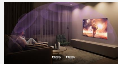
Dolby Vision IQ & Atmos

Le processeur α9 Gen 5 AI virtualise une source audio 2 canaux en un son immersif 7.1.2. Vivez l'action et le chaos autour de vous, comme si vous étiez le personnage principal du film.