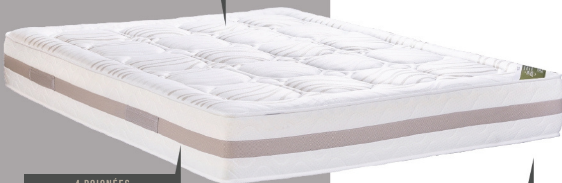
4 POIGNÉES HORIZONTALES COUSUES