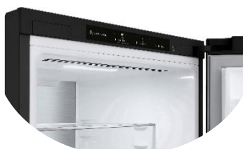
Affichage intérieur discret