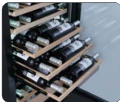
Clayette à rail télescopique